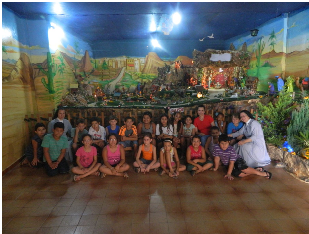
Visita ao Presépio da Igreja Matriz de São José

Educar é construir o futuro para o infinito