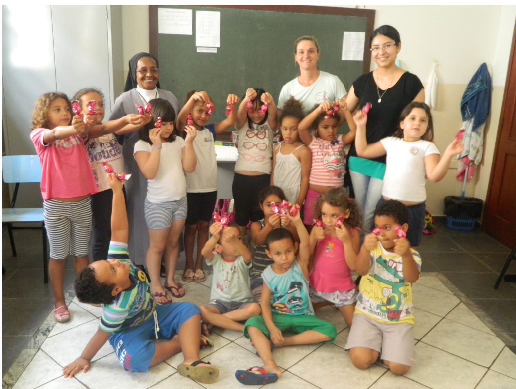
Atividade de Ensino Religioso