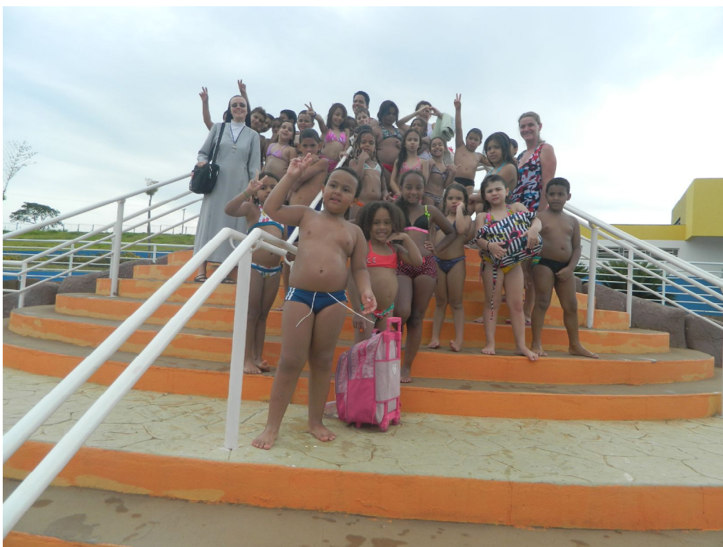
Cidade da Criança