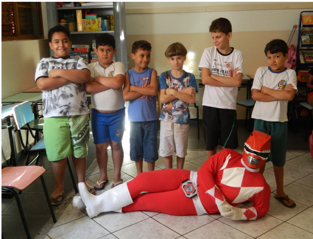
Atividade Lúdica com Personagem da TV

Educar é construir o futuro para o infinito