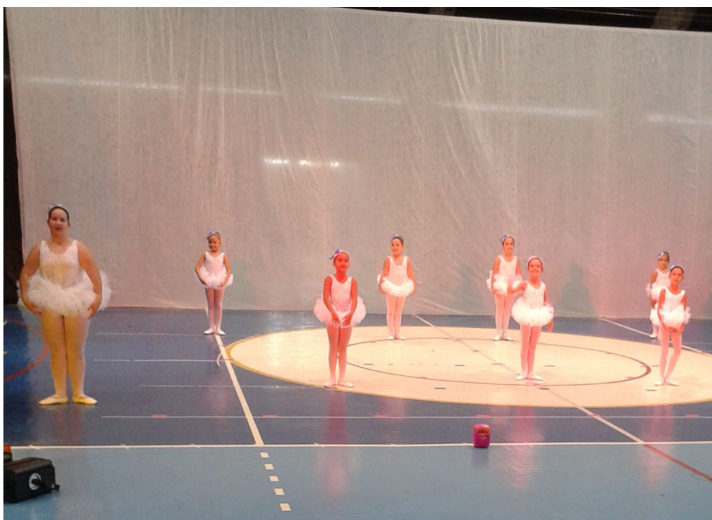
Espectáculo de dança da Escola Fabiane Ortega (assistido pelas crianças e adolescentes)