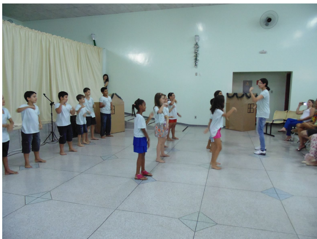
Apresentação de Natal