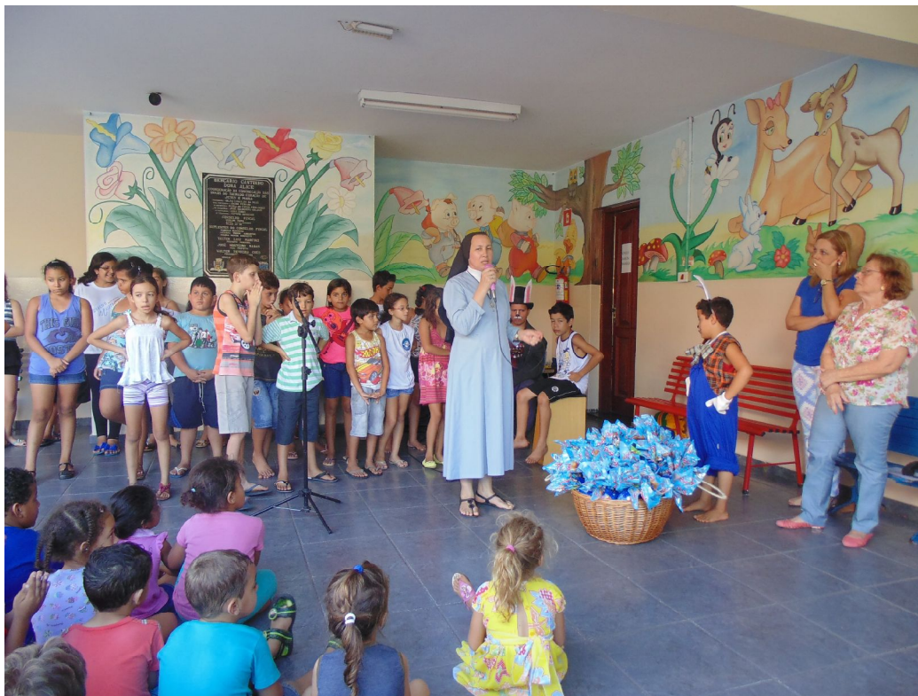
Apresentação de Páscoa

Educar é construir o futuro para o infinito