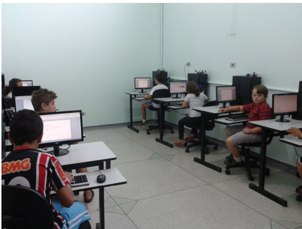
Aula de Informática