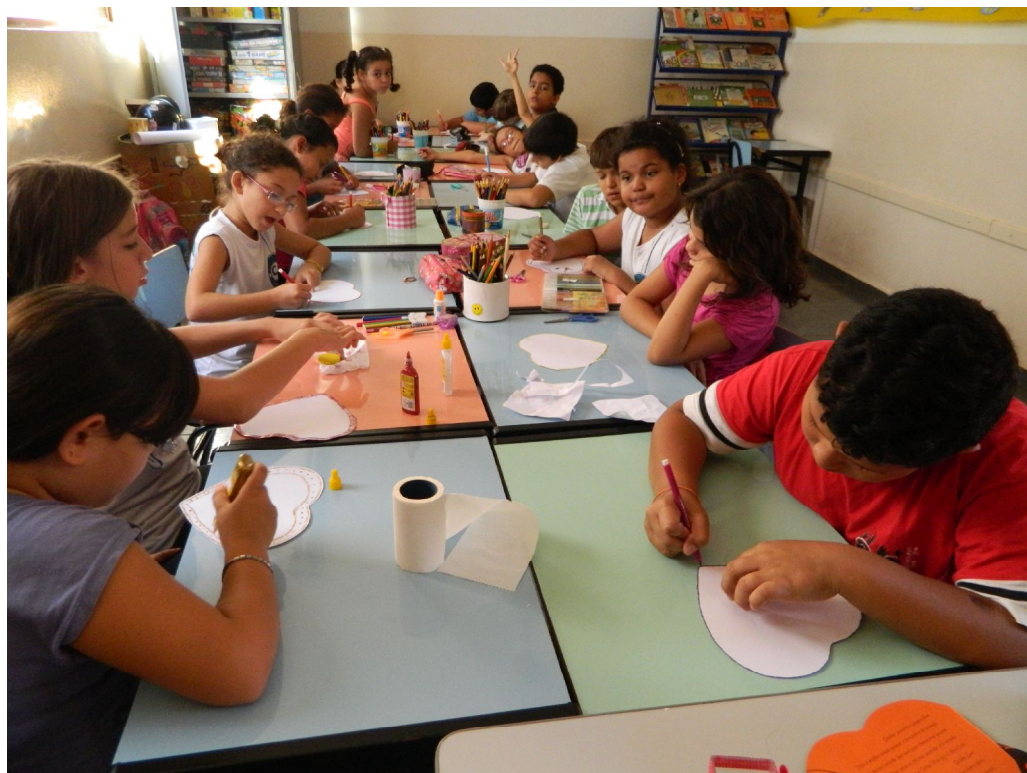
Confecção de lembrancinha do Dia das Mães