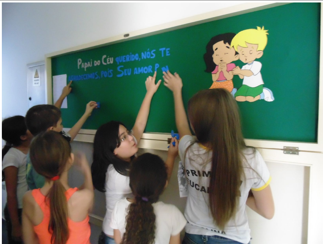
Caracterização dos painéis do Cantinho

Educar é construir o futuro para o infinito