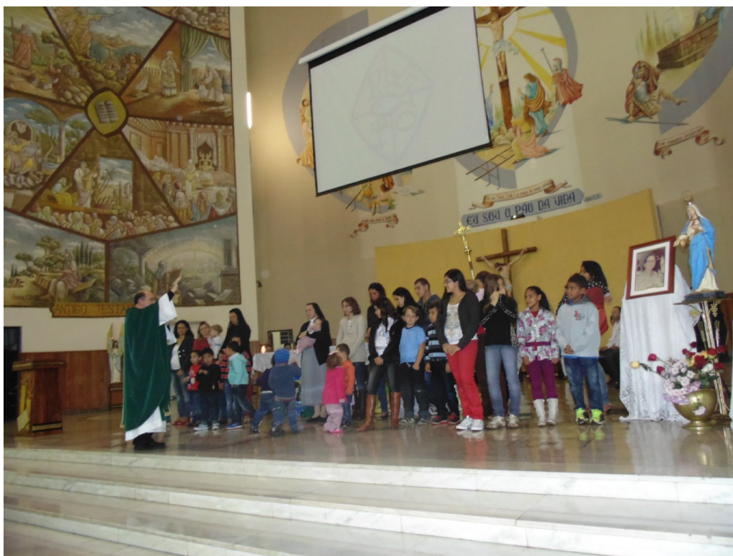
Missa em comemoração aos 25 anos