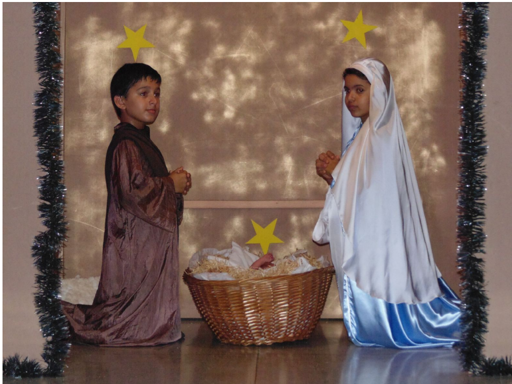
Nascimento de Jesus