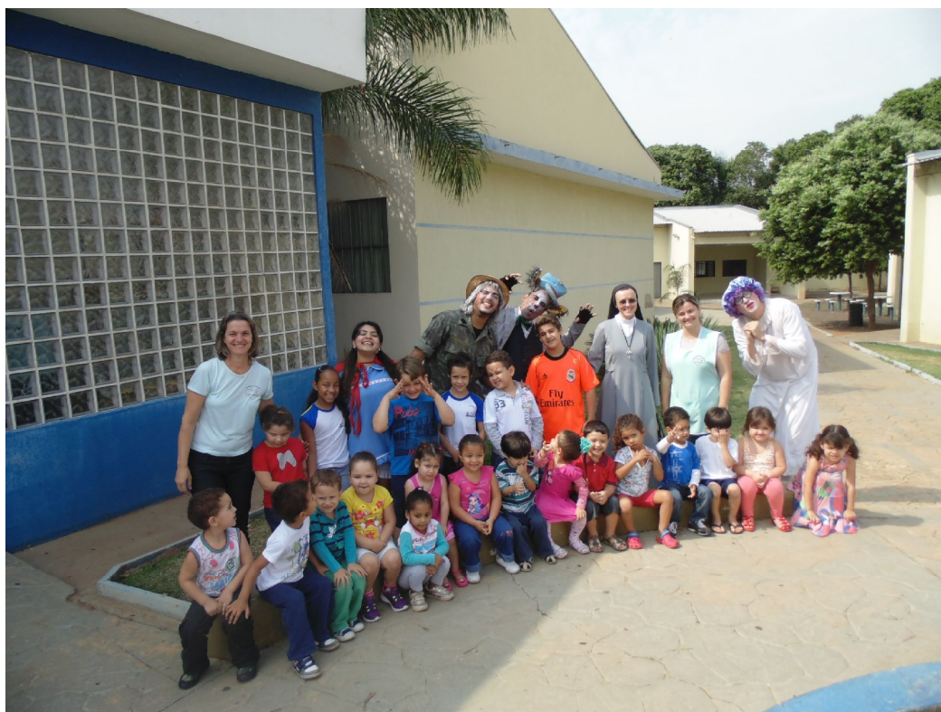
Foto com o elenco da peça teatral