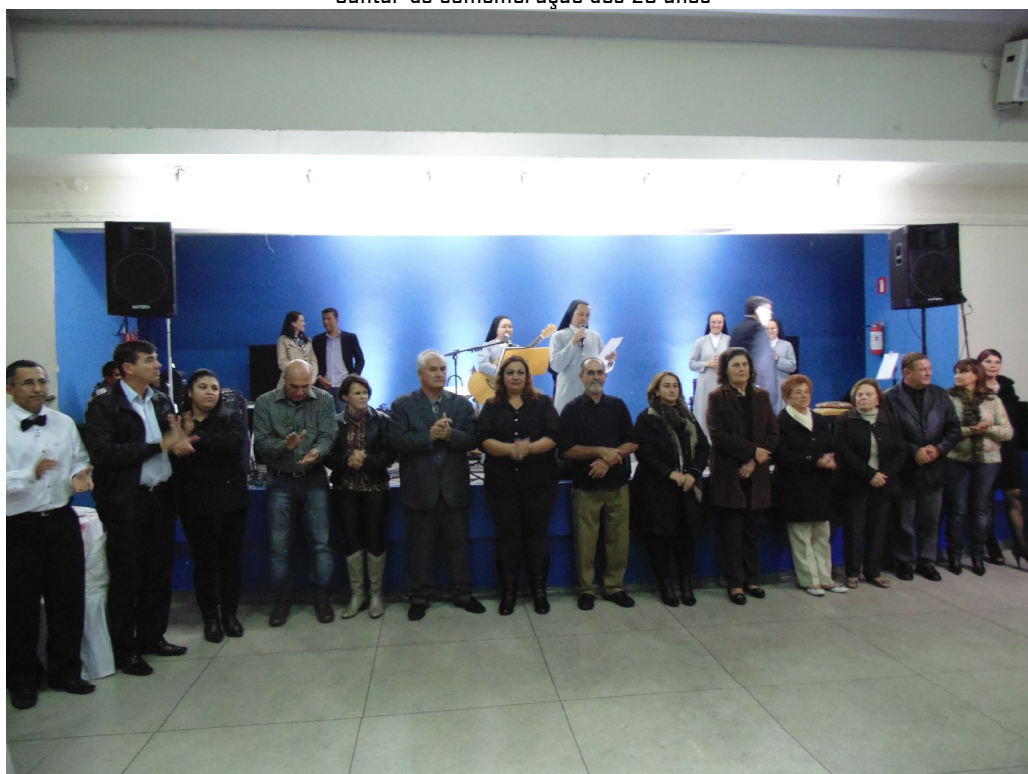
Homenagem aos colaboradores do Cantinho