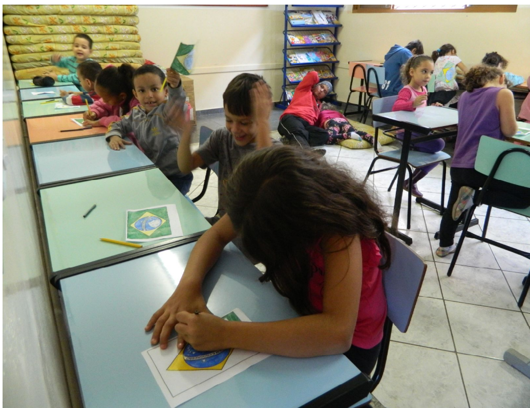
Atividade sobre a Copa do Mundo