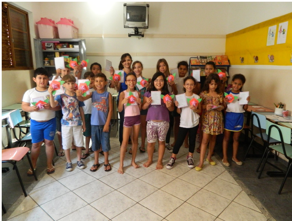
Lembrancinha do Dia das Mães

Educar é construir o futuro para o infinito