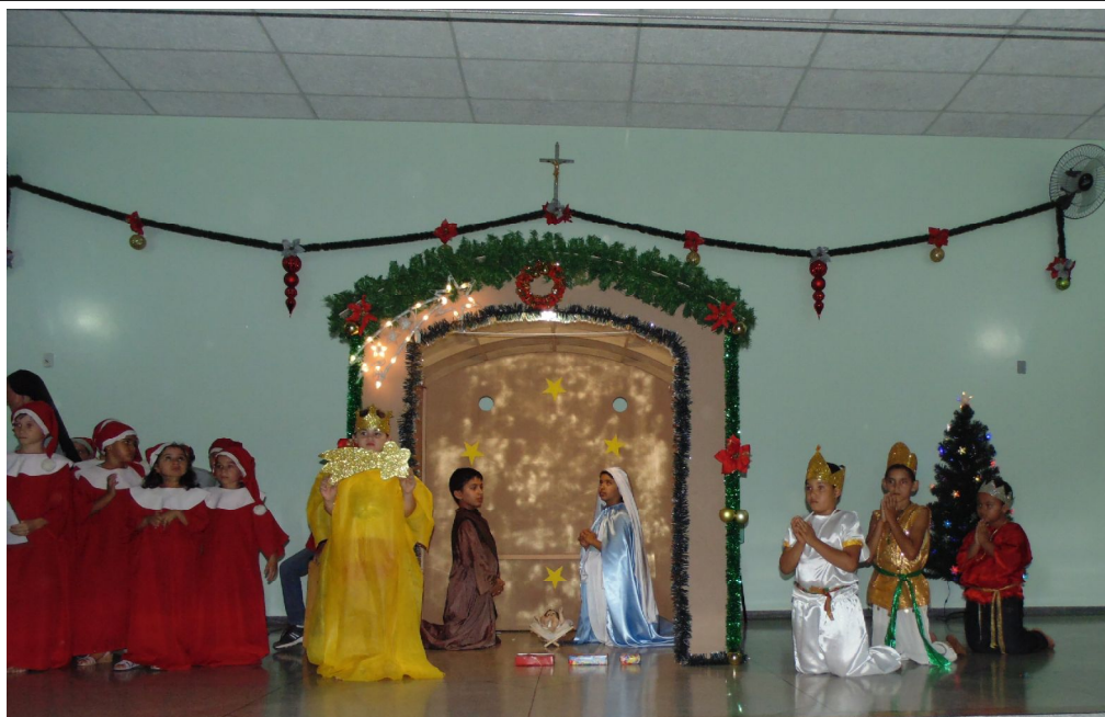
Encenação de Natal

Educar é construir o futuro para o infinito