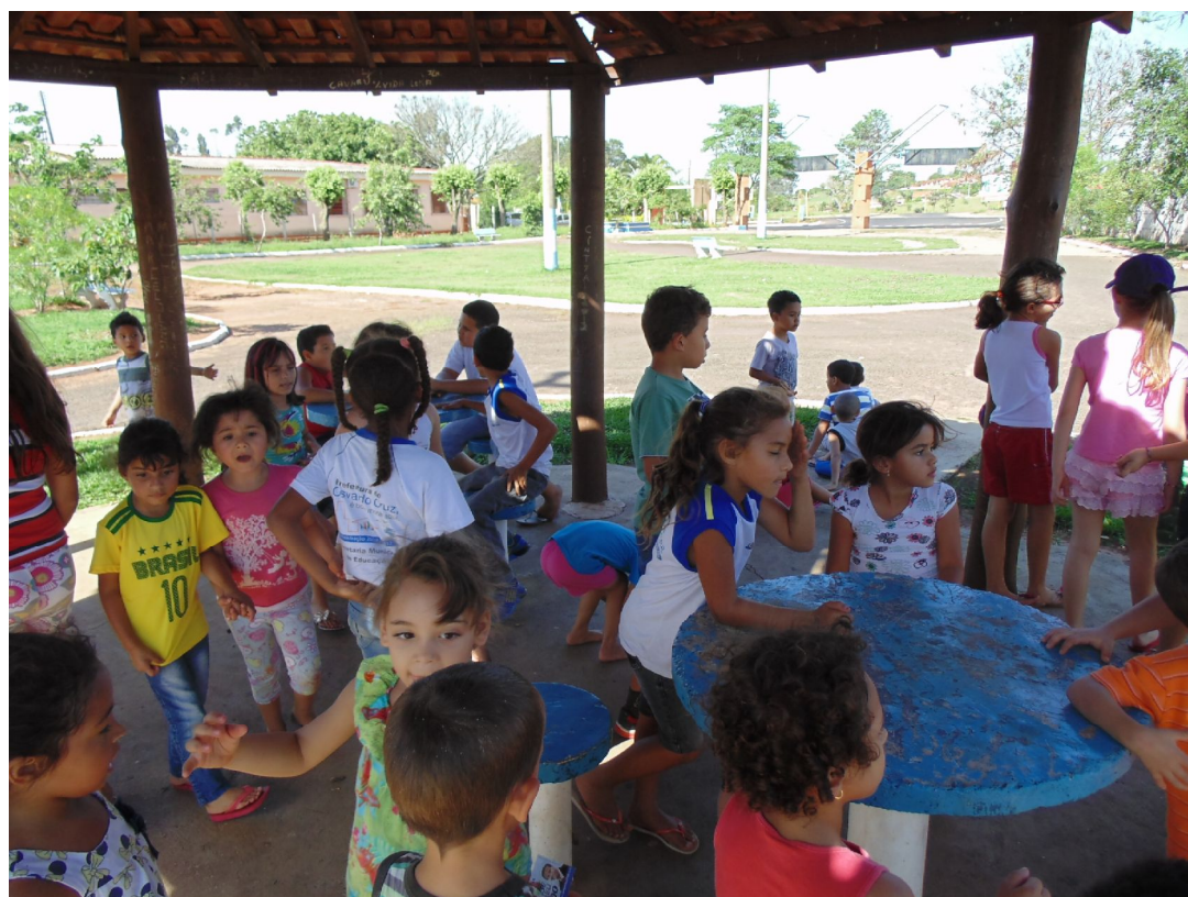
Lazer no Parque do Povo