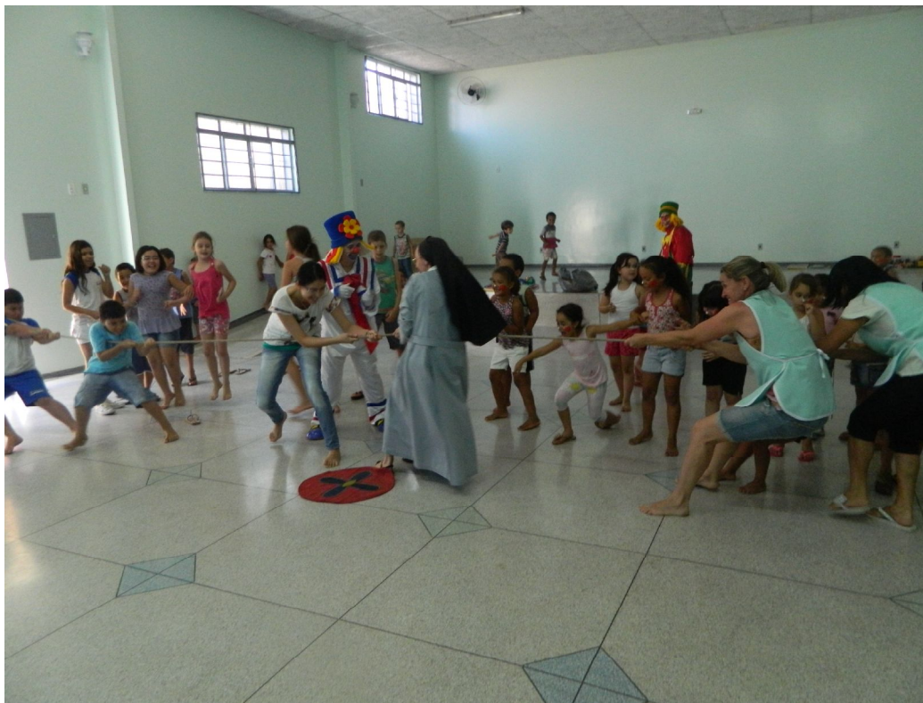
Gincana da Semana da Criança