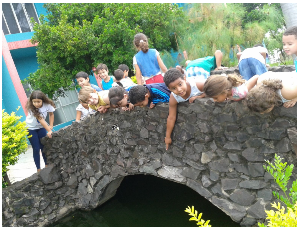
Visita à Fonte da Faculdade REGES