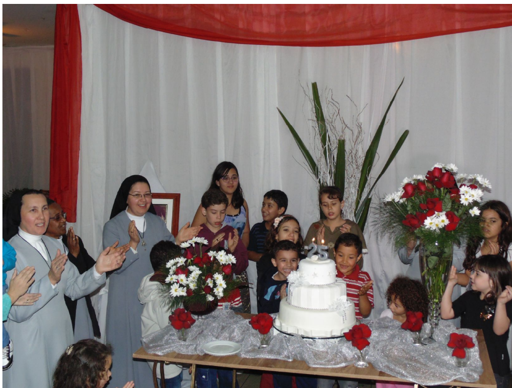
Comemoração aos 25 anos de inauguração do Cantinho