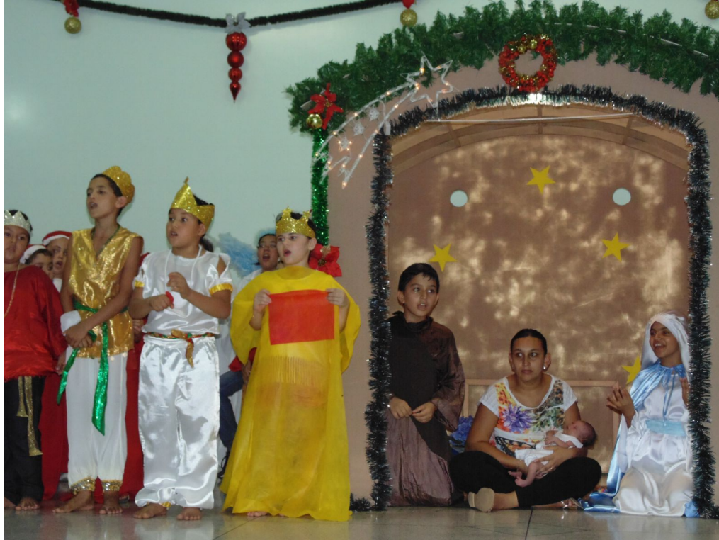
Encenação de Natal