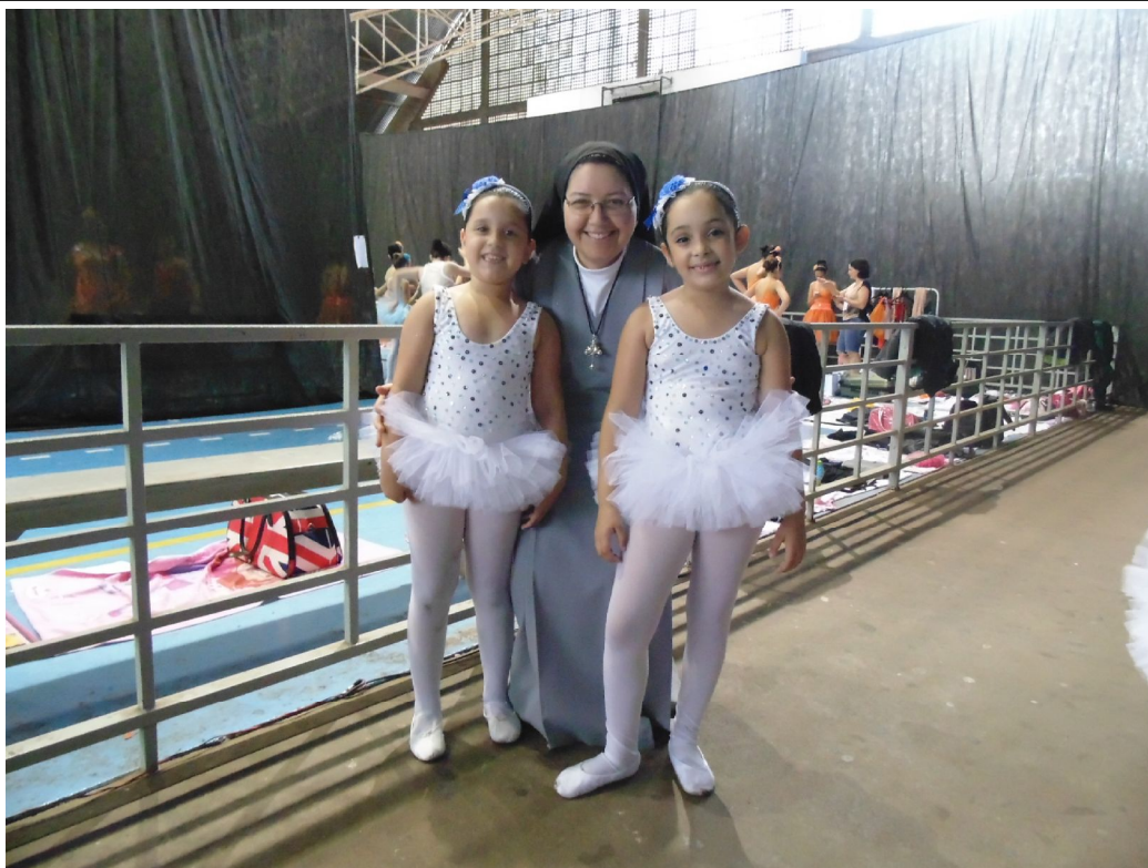
Participação em Espetáculo de Dança

Educar é construir o futuro para o infinito