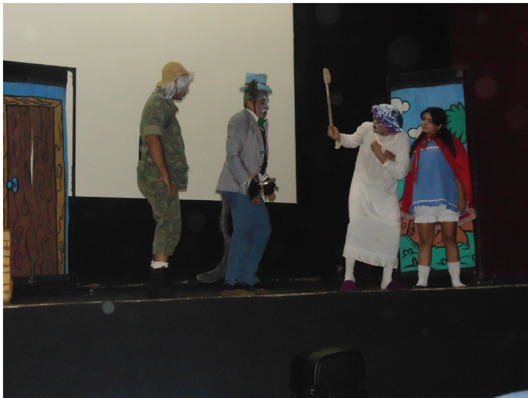
Apresentação Teatral: "Chapeuzinho Vermelho" (assistido pelas crianças e adolescentes)