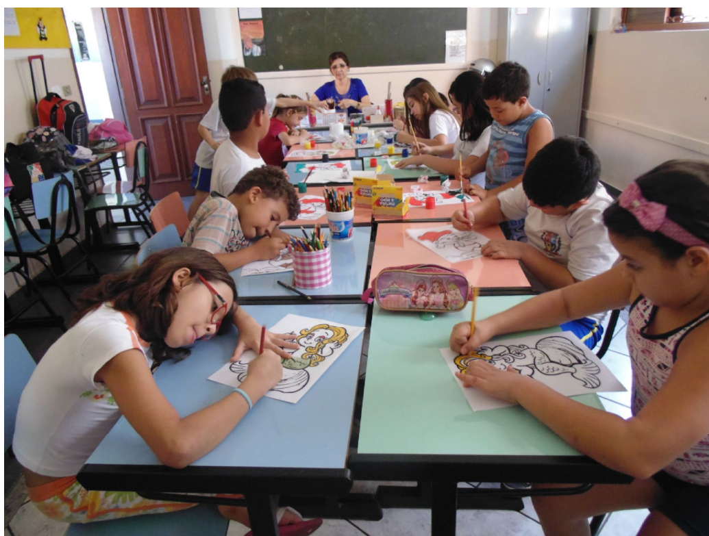
Dia do Folclore