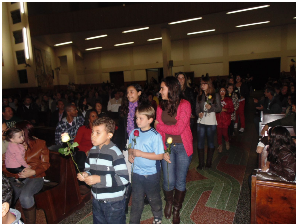
Missa em comemoração aos 25 anos

Educar é construir o futuro para o infinito