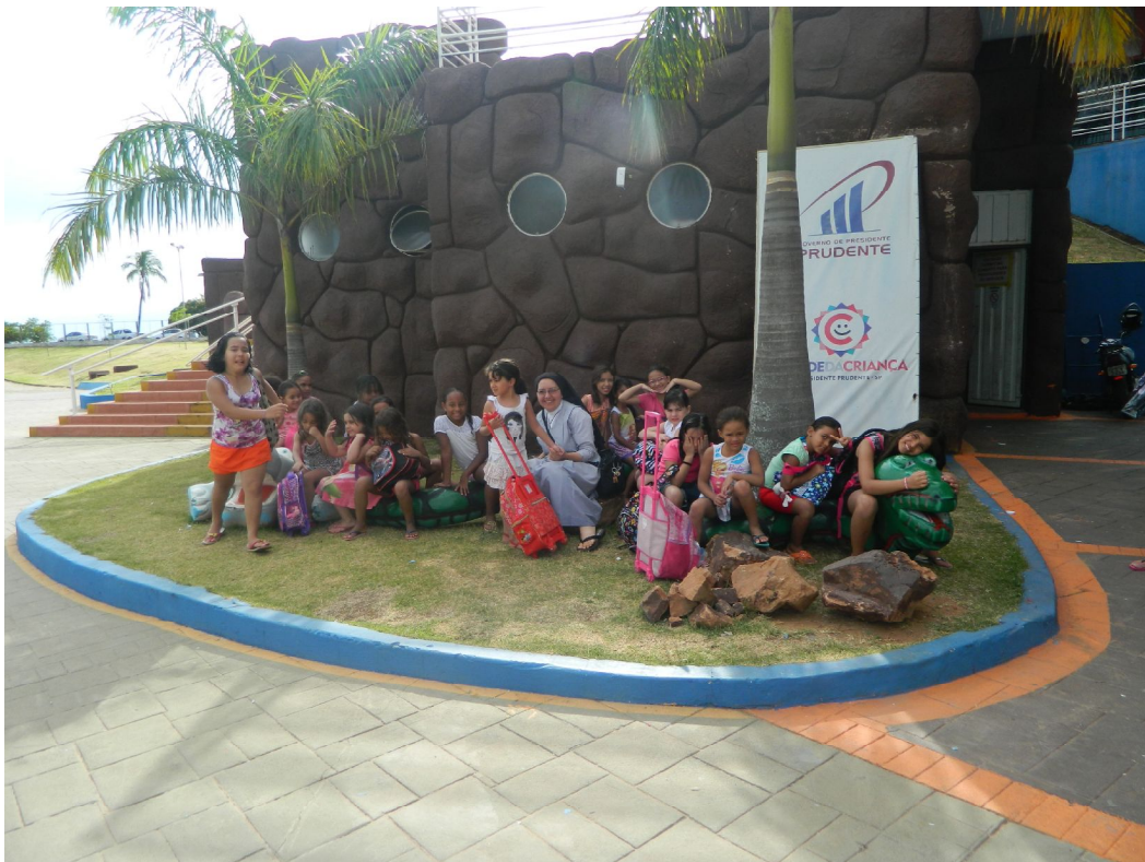
Passeio na Cidade da Criança

Educar é construir o futuro para o infinito