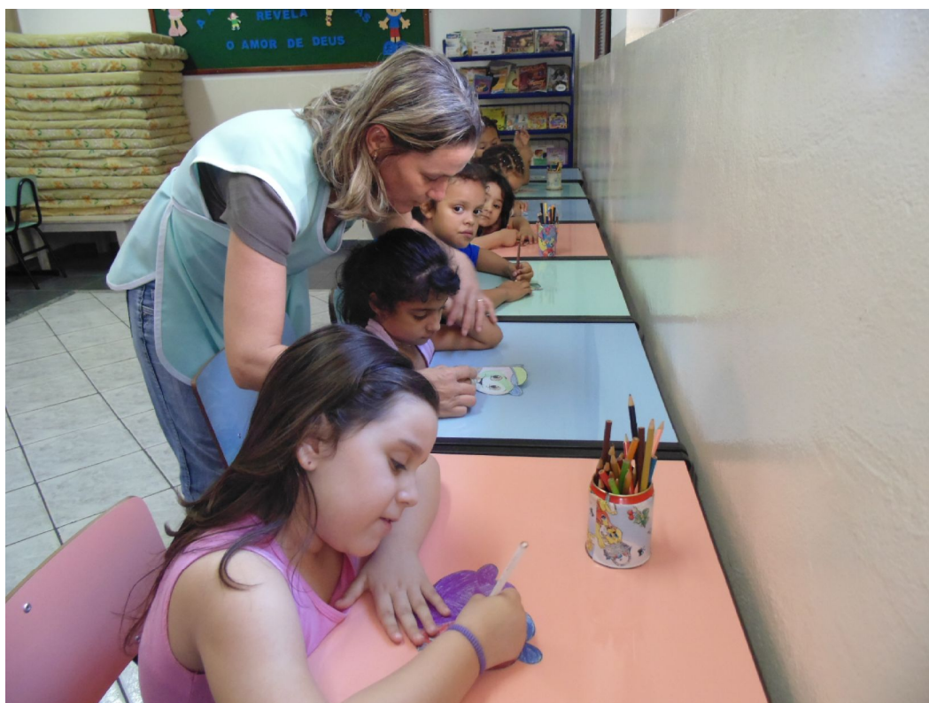
Confecção das lembrancinhas do Dia dos Pais