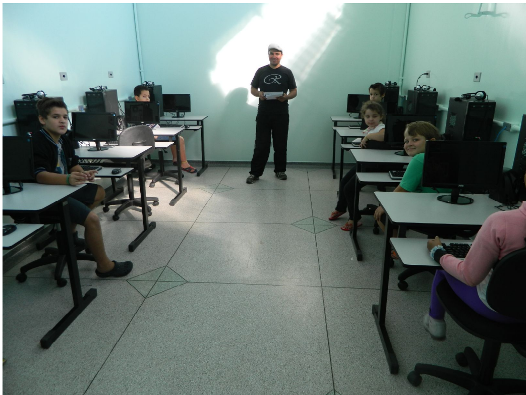
Aula de Informática

Educar é construir o futuro para o infinito