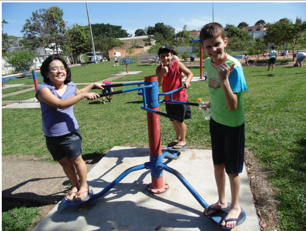
Passeio no Parque do Povo (Semana da Criança)

Educar é construir o futuro para o infinito