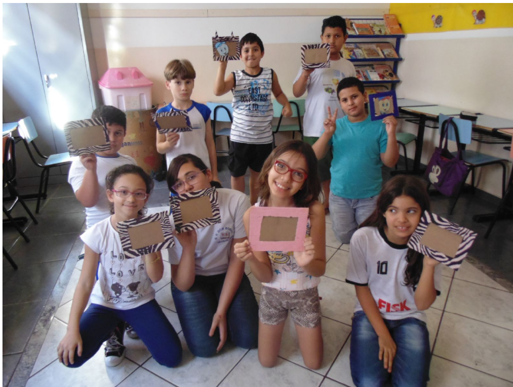
Confecção das lembrancinhas do Dia dos Pais

Educar é construir o futuro para o infinito