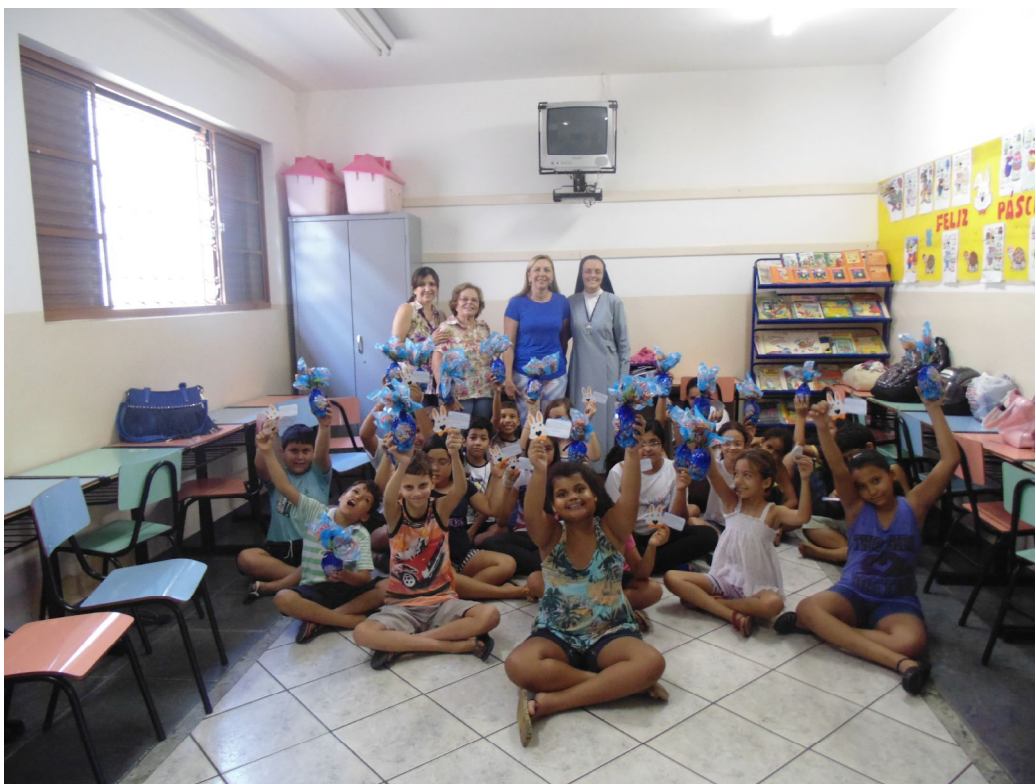
Entrega dos Ovos de Páscoa