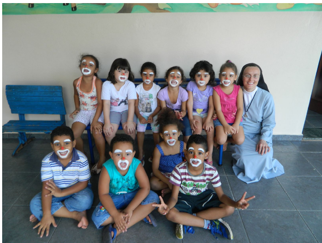
Dia do Circo