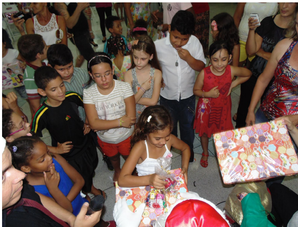
Entrega dos presentes pelo Papai Noel