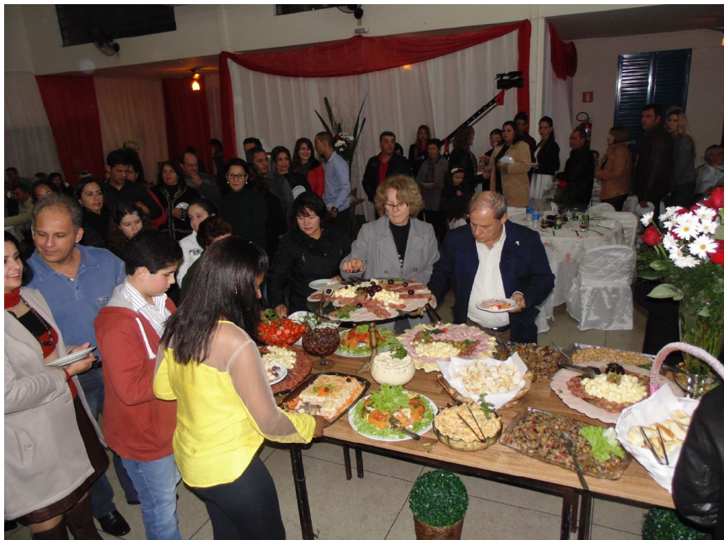
Jantar de comemoração dos 25 anos

Educar é construir o futuro para o infinito