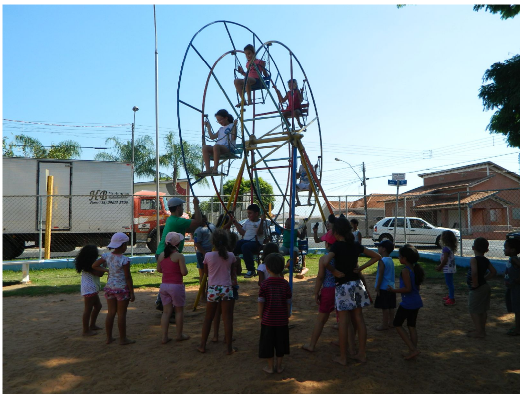
Passeio no Parque da Matriz (Semana da Criança)